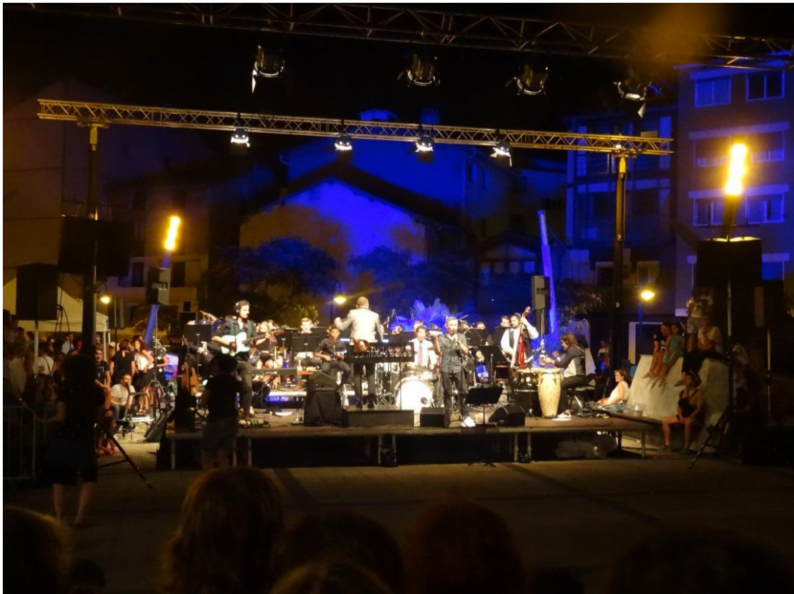
Zumaiako Musika Banda eta TikTara