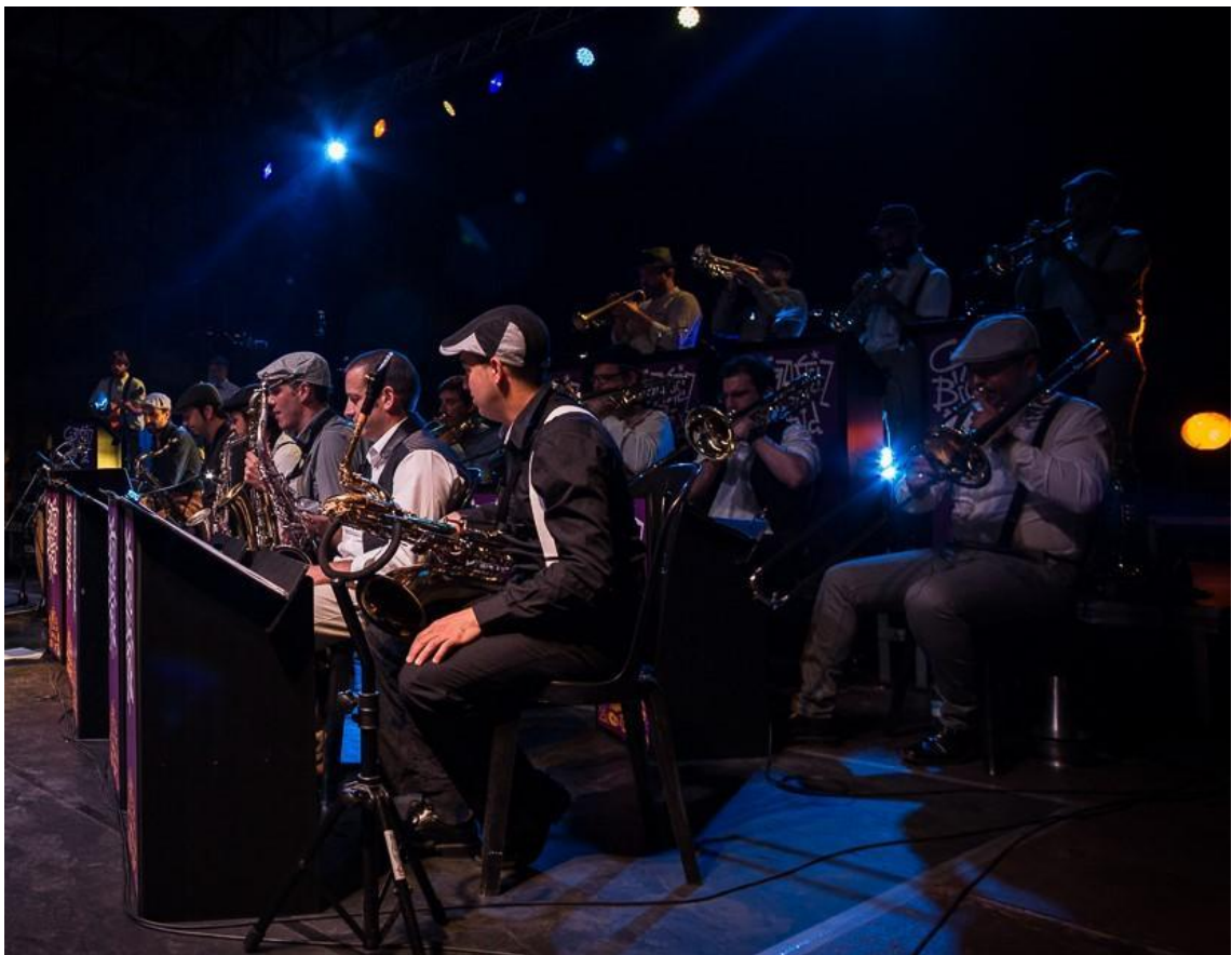
Gasteiz Big Band