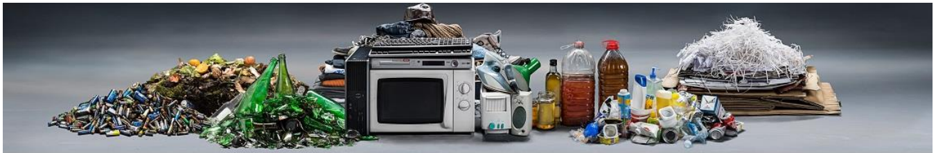
Zabor bilketa zerbitzua mankomunatzeko akordioa, 2016-12-01